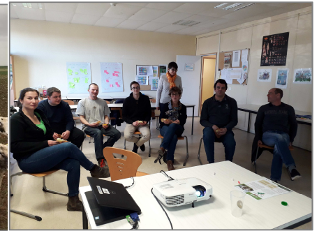
Le groupe So_perfects d'OBL