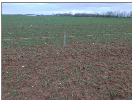
A Bourges, l'orge pâturée en sortie de parcelle