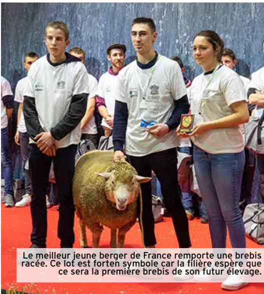
Le meilleur jeune berger de France remporte une brebis racée. Ce lot est fort en symbole car la filière espère que ce sera la première brebis de son futur élevage.