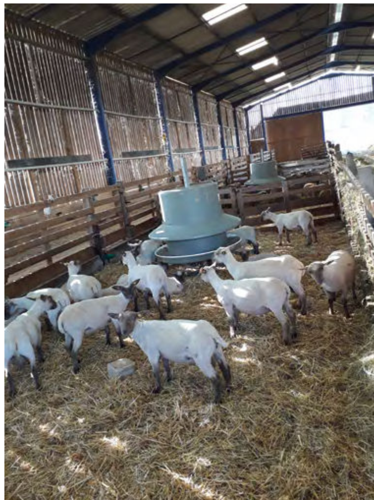
Les agneaux tondus sont plus faciles à trier pour la vente.