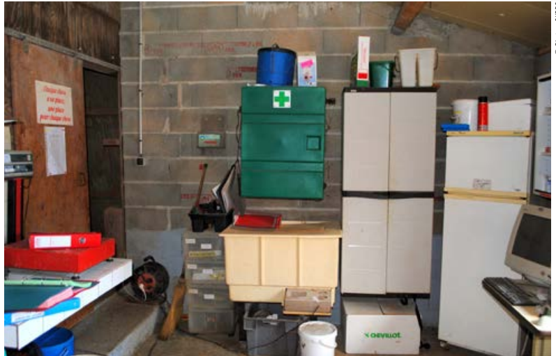
Un espace pour ranger le matériel nécessaire